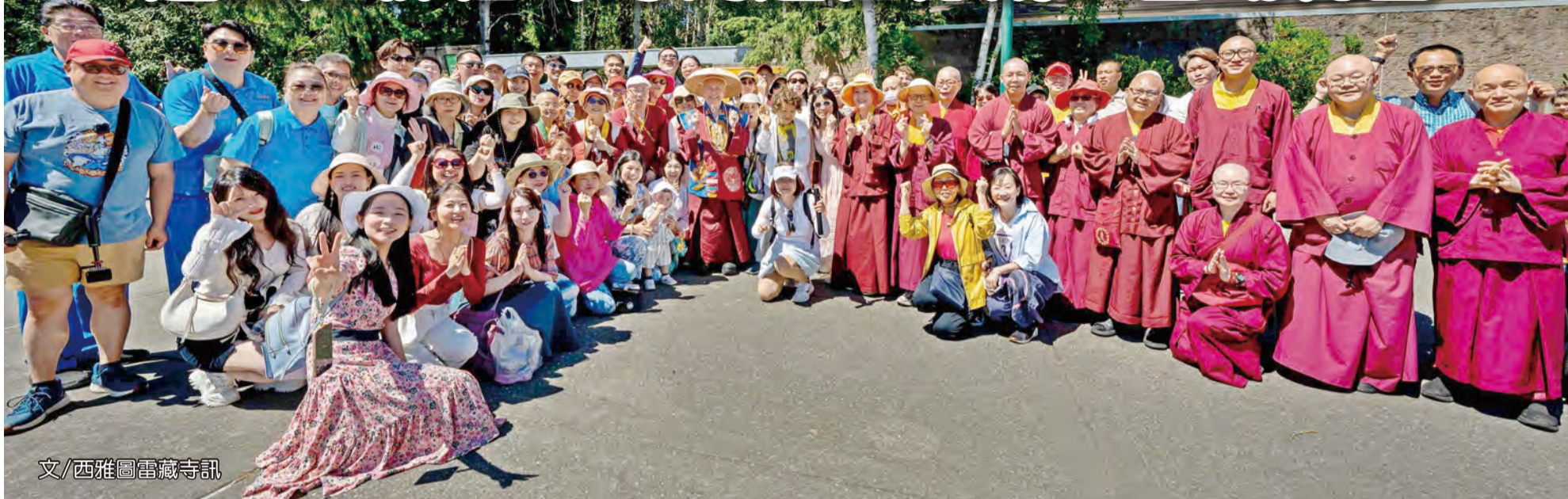
文/西雅圖雷藏寺訊

2026年6月18日下午，西雅圖雷藏寺與彩虹雷藏寺眾上師、法師、弘法人員及同門近百人，在雷藏寺用過午餐後，一同前往西雅圖伍德蘭公園動物園（Woodland Park Zoo）遊覽。這是繼西雅圖亞洲藝術博物館、斯諾誇爾米瀑布之後，「與佛同樂」系列第三站。