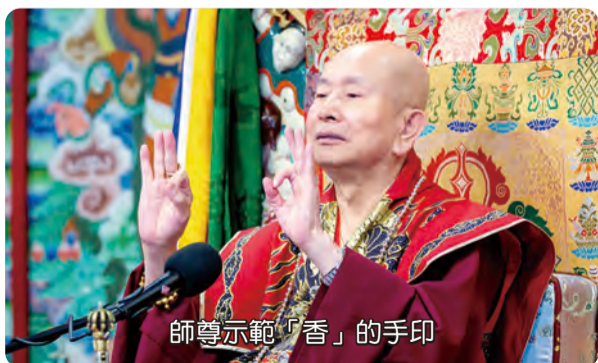
師尊示範「香」的手印

塗香手印，我記得每一次在做手印的時候，有做花、香、燈、茶、果手印。花（師尊示範手印），這個就是香（師尊示範手印），這是五種供養，所以你做「香」的手印就可以了。