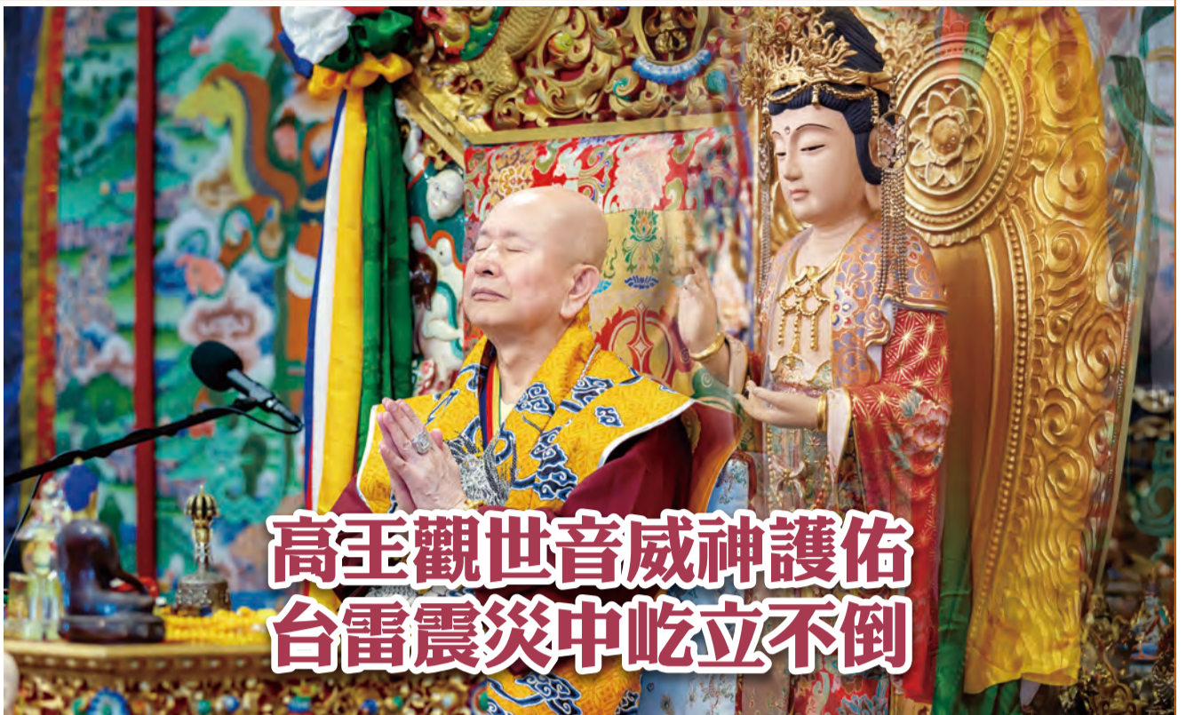
高王觀世音威神護佑 台雷震災中屹立不倒

《高王觀世音經》我唸得很熟，都可以從頭背到尾，從中間也可以背到尾，從尾巴也可以背到前面，背來背去通通會了。「七佛滅罪真言」還講，死了可以變成活，這嚇死人了，這死了都可以變成活，不唸不行！希望高王觀世音菩薩，發發你的威力，像這一次大準提佛母法會，就看到economy too bad，主祈很少。那麼大的最勝金剛跟清淨金剛，主祈者那麼少，這世界經濟大概快要完蛋了