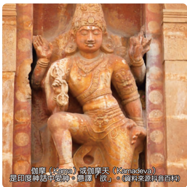
伽摩 (Kama) 或伽摩天 (Kamadeva) 是印度神話中愛神。意譯「欲」。(資料來源抖音百科)

暴富，就是欲望，一喊就是欲望，希望中獎，那就是欲望，不是欲望是什麼？愛啊！男貪女愛，男的也愛，女的也愛，人本身就是愛欲。那修行要盡量少欲知足，要把愛欲減少，知道滿足，少欲知足就是修行，所以《楞嚴經》也會提到這些，所謂六根、六塵、六識，都是充滿了愛欲。