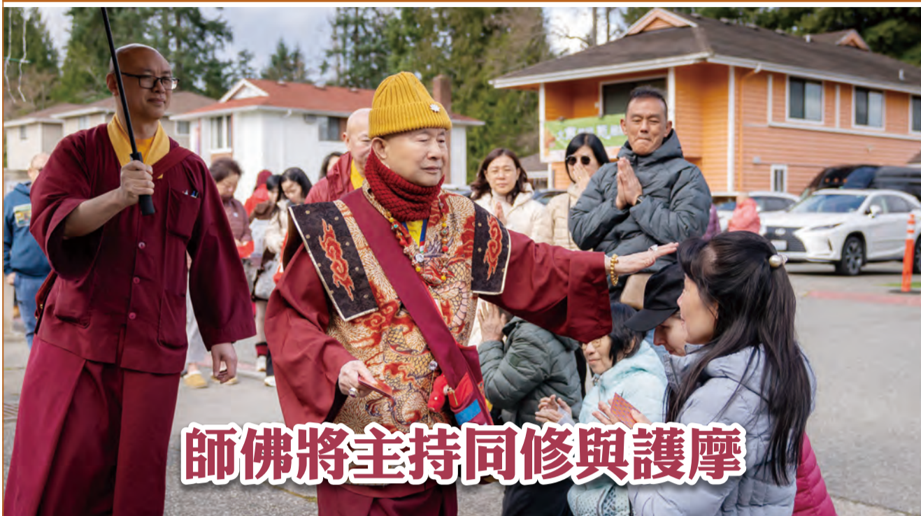
師佛將主持同修與護摩