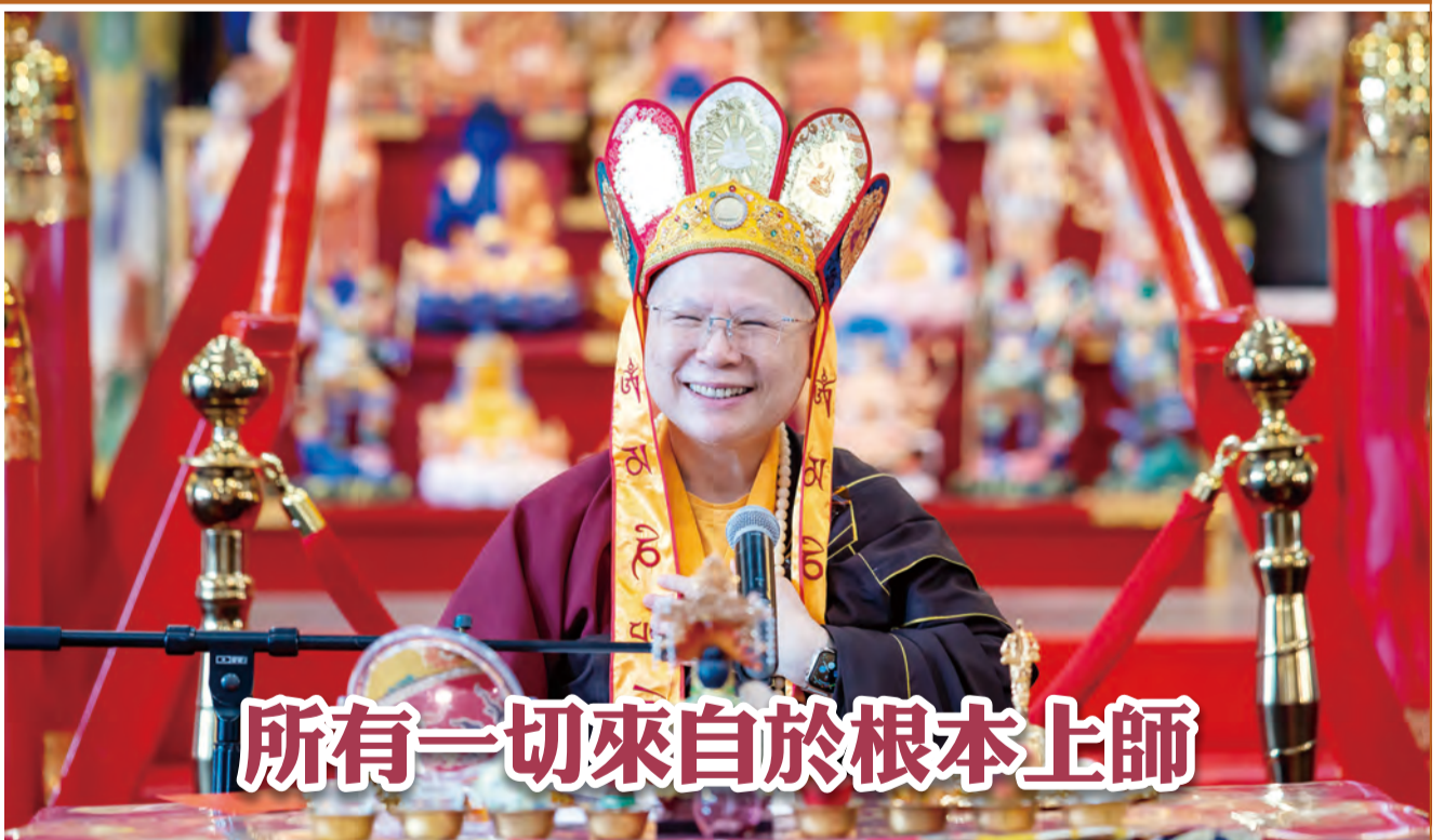
所有一切來自於根本上師

祂前一陣子身體不舒服的時候，那時候我們請教師尊，師尊以前閉關，大部份是禮拜六問事，禮拜一到禮拜五沒有，就是修法同修，只有一個禮拜問事一次。後來呢，他真的覺得……我心裏面的想法，我們人壽不長，所以祂總想祂有限的時光內，多多的加持所有的同門，所以祂藉這個問事的機會一直在滿足眾生的願。有時候我們跟祂講說不用吧，祂說要。祂摸頭，我們講師尊休息吧，不行，要摸！你看早也摸、晚也摸。祂都藉這個機會，其實祂也不是貪圖你那一塊錢的供養，是不是啊？但是祂是藉這個機會在加持祂心愛的弟子。