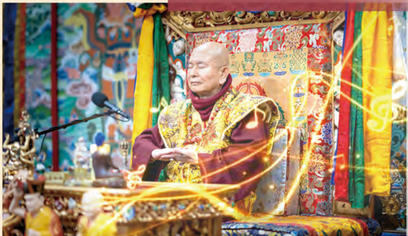
真佛宗網路大學 世界真佛宗宗務委員會 教育處