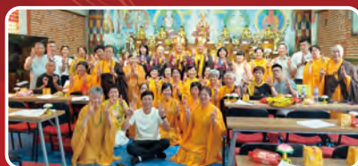
巴西華光功德會真諦分會