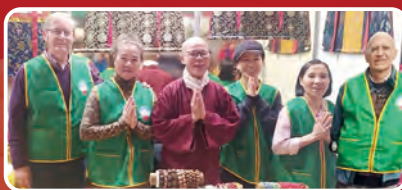
西班牙華光功德會明照分會