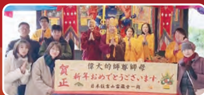
日本華光功德會大阪分會