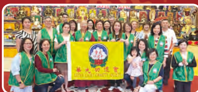
澳洲墨爾本華光功德會