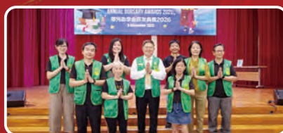
華光功德會（新加坡）