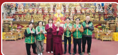
英國華光功德會真渡分會