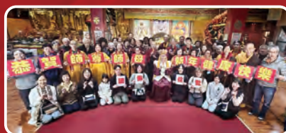
加拿大溫哥華華光功德會