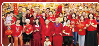
澳洲悉尼華光功德會