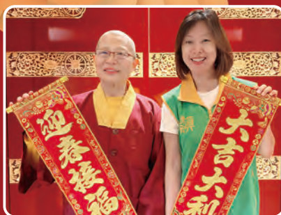
世界真佛宗華光功德會