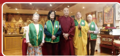
瑞典華光功德會修德分會