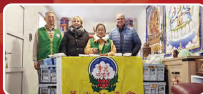
法國華光功德會大弘分會