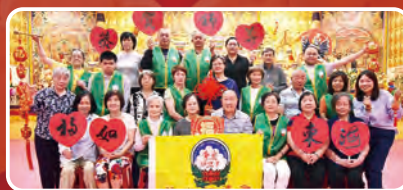
澳洲華光功德會墨爾本善明分會