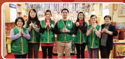
德國華光功德會忍智分會