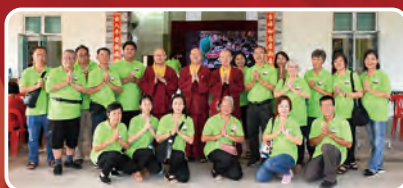
馬來西亞華光功德會