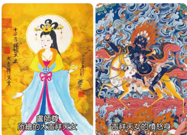
盧師尊所繪的大吉祥天女

Q2 吉祥天女有柔和天女貌，亦有金剛忿怒像。是否修習息災、敬愛時觀想天女貌；祈求結界