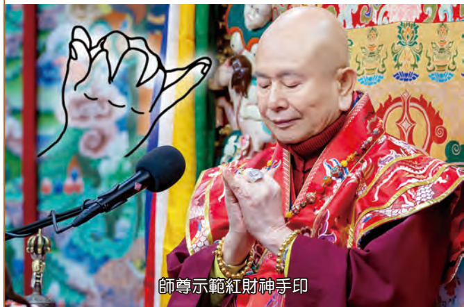
師尊示範紅財神手印

財神祂的咒是「嗡，嘎那巴底耶，梭哈。」，手印就是象鼻手印這樣子（師尊示範結手印）。