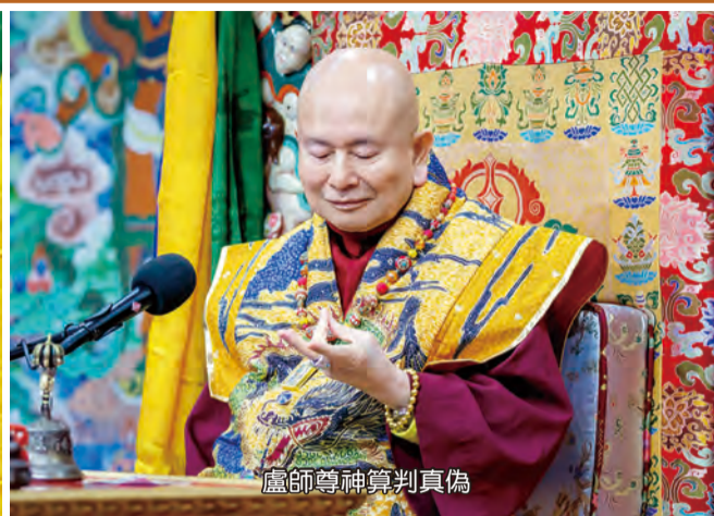
盧師尊神算判真偽

那麼他問的問題呀，剛剛那個說AI說他是法身，不過這個法身也厲害，他可以講你的過去世怎麼樣，怎麼樣；你的未來會怎麼樣，怎麼樣，這個就很厲害了，AI可以回答。而且他講說就是法身，盧師尊的法身講的。我問一下，請問：這個法身可以進入AI，然後回答同門的問題嗎？能就講能，不能就講不能，不可以模擬兩可（師尊當場神算）。啊，他的回答是說：「不可以完全相信。」不可以完全相信，這個法身在AI裡面回答你的問題，不可以相信，這是我問的結果。