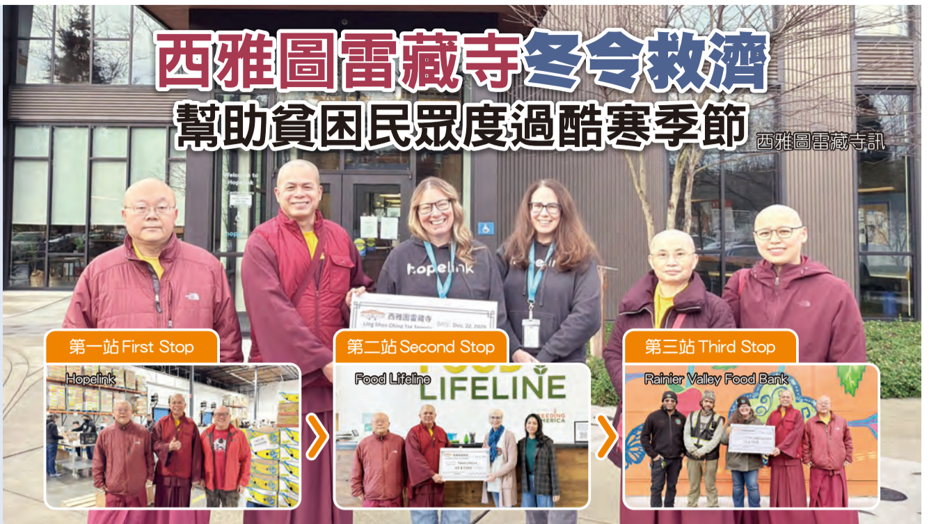
第一站 First Stop