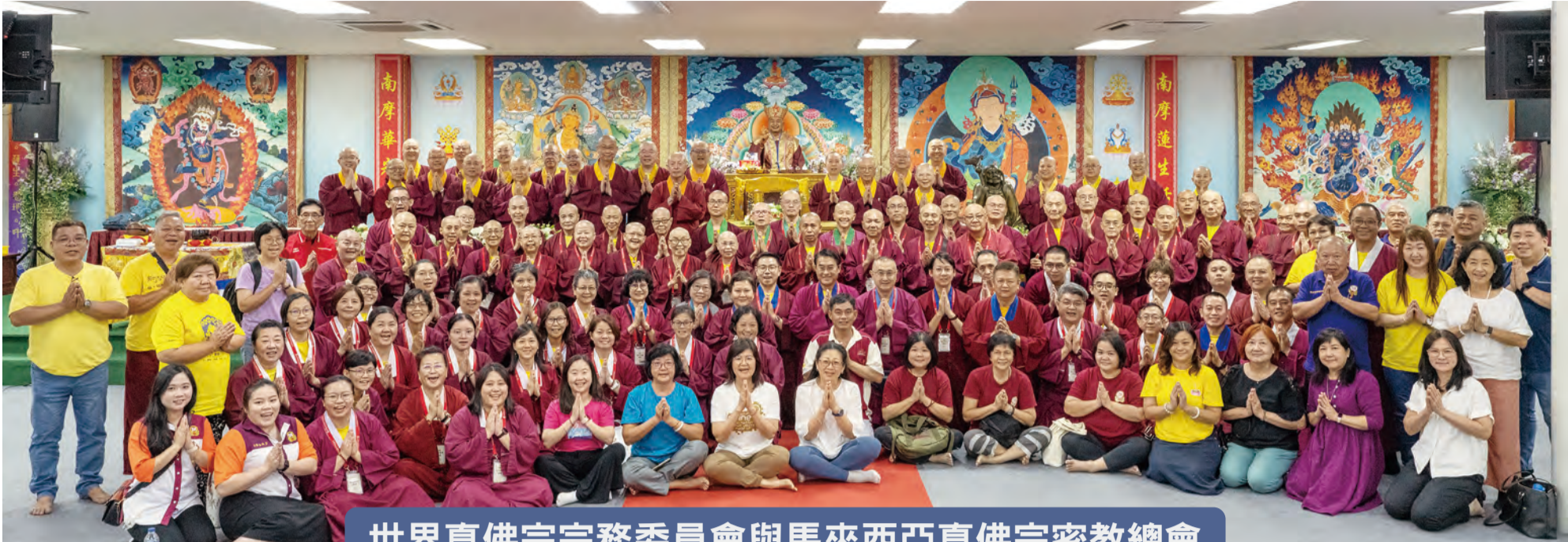
世界真佛宗宗務委員會與馬來西亞真佛宗密教總會