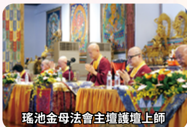
瑤池金母法會主壇護壇上師