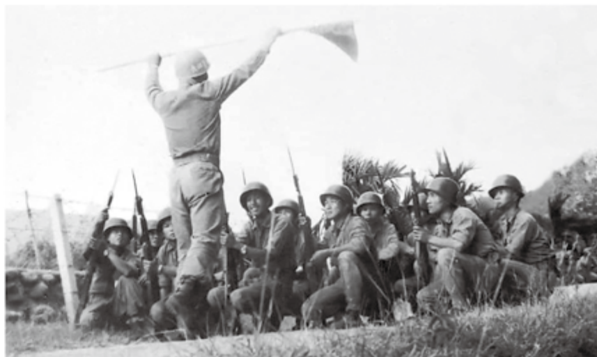
▲車籠埔營區也被新兵稱為「淒慘埔營區」，以嚴格的訓練作風而聞名全軍。在民間流傳的新兵訓練艱苦等級名列第一。