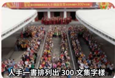
人手一書排列出 300 文集字樣