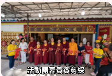
活動開幕貴賓剪綵