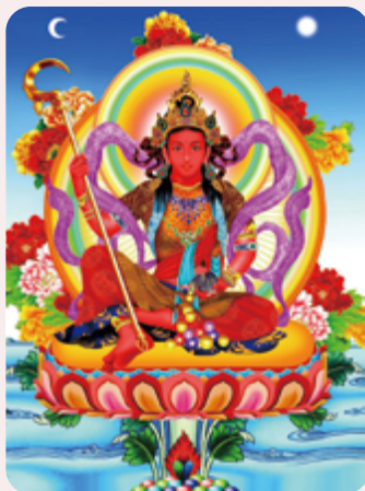
蓮生活佛盧勝彥文集第 233 冊——七十仙夢

我在水龍年（二〇一二年）的年初，由「張佳琪」小姐主持，二位名嘴「林朝鑫」、「許聖梅」三人講談年運。