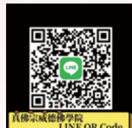
真佛宗威德佛學院 LINE QR Code