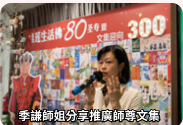
季謙師姐分享推廣師尊文集