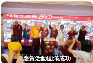
慶賀活動圓滿成功