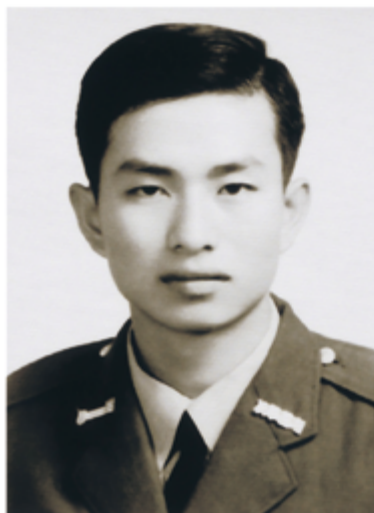
▲1964年考進測量學校的大地測量系就讀