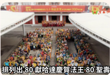
排列出 80 獻哈達慶賀法王 80 聖壽