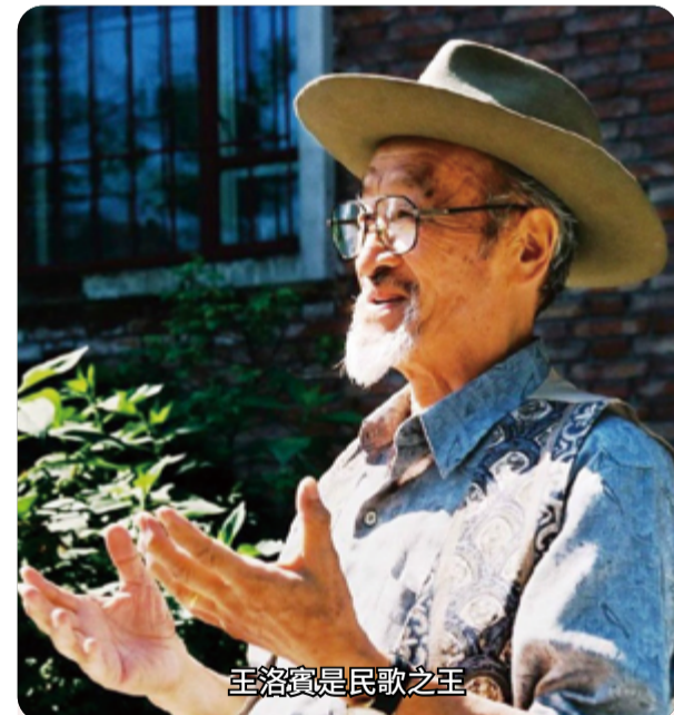
王洛賓是民歌之王

王洛賓 (1913.12.28~1996.3.14)，名榮庭，字洛賓，曾用名艾依尼丁，漢族人，出生北京，中國民族音樂家。1938 年（民國二十七年），王洛賓在蘭州改編了新疆民歌《達坂城的姑娘》，之後便與西部民歌結下了不解之緣，並將一生都獻給了西部民歌的創作和傳播事業，有「西北民歌之父」、「西部歌王」之稱。王洛賓 78 歲皈依佛教，並創作了多首佛教歌曲。（摘自：原文網址： https://read01.com/8mPyx0.html ）