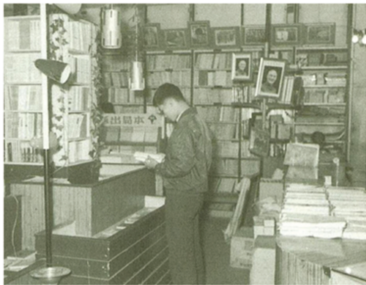
▲為了追求知識兼顧省錢，當時大多站在書局裡把一本書看完。 (資料來源_好文青)