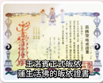
王洛賓正式皈依蓮生活佛的皈依證書

王洛賓 (1913.12.28~1996.3.14)，名榮庭，字洛賓，曾用名艾依尼丁，漢族人，出生北京，中國民族音樂家。1938 年（民國二十七年），王洛賓在蘭州改編了新疆民歌《達坂城的姑娘》，之後便與西部民歌結下了不解之緣，並將一生都獻給了西部民歌的創作和傳播事業，有「西北民歌之父」、「西部歌王」之稱。王洛賓 78 歲皈依佛教，並創作了多首佛教歌曲。（摘自：原文網址： https://read01.com/8mPyx0.html ）