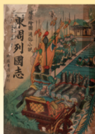
▲《東周列國志》，臺中瑞成書局發行，鉛印本。