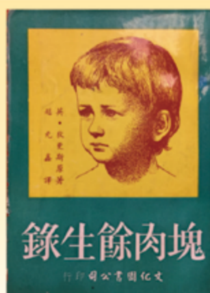
▲1955出版，元森《塊肉餘生錄》台北：新興書局。