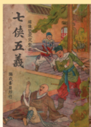
▲《七俠五義》，臺中瑞成書局發行，鉛印本。