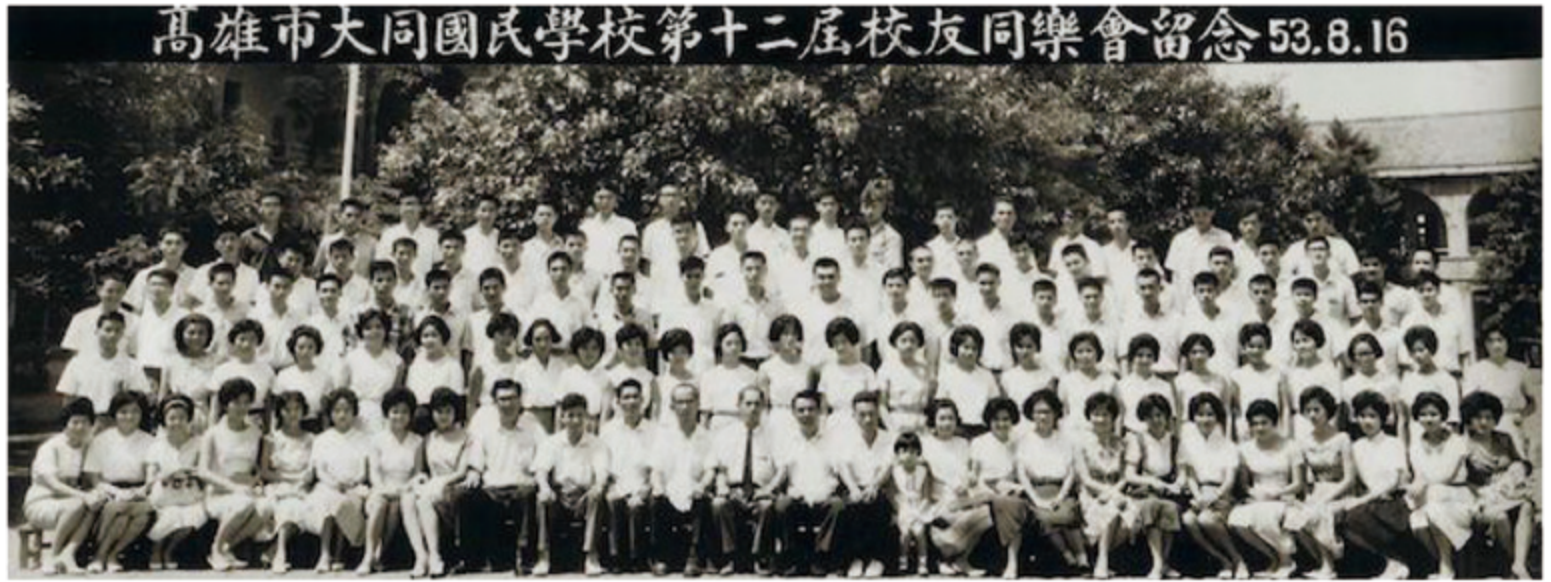
▲高雄市大同國小第十二屆校友會53.8.16，倒數第三排右八是盧勝彥(蓮生活佛)

仔吃素，老鼠仔要當和尚啊！哈哈。」這些舉動，讓小勝彥為自己的家境感到自卑不已，彷彿做錯事見不得人一般，他不知道要怎麼為自己辯白，急得面紅耳赤，丟臉到恨不得鑽地說：「我不當和尚，我不是和尚！」他拿著便當倏然站了起來，逃到校園裡最偏僻沒有人的地方，快速地把便當吃掉。