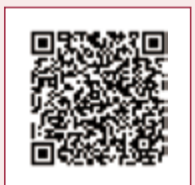
晉塔旋轉 360 度破除煞氣 QRcode

● 晉塔： 塔位的門是外分金，骨罐刻名的朝向是內分金。晉塔時將骨灰罐旋轉 360 度可以破除一切方位煞氣。