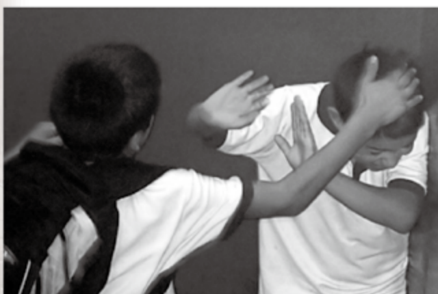
▲小勝彥長期被霸凌。(示意圖)