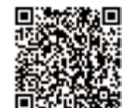
快速掃描 QRcode 一起同步線上學習

6. 另外「樹葬」、「花葬」、「海葬」.... 等葬法，各有重點。師尊開示樹葬跟海葬符合環保的需求，如果要這樣做，還是海葬比較好，更環保。從無形的層面來說，會不會有不好的影響？蓮生活佛認為水葬、火葬、土葬都好；但是樹葬，蓮生活佛認為真會有不好的影響。依照上述開示，只要往生極樂佛國，什麼葬法都好。靈體不會受葬法地理風水影響，又能福德綿綿庇祐子孫。