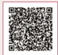
蓮生活佛生基示範呼龍 QRcode