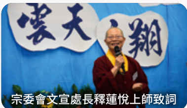
宗委會文宣處長釋蓮悅上師致詞