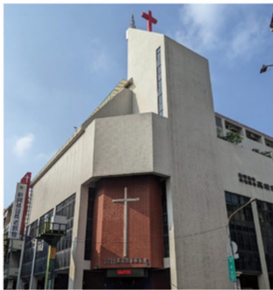
▲勝彥小學四年級去的基督教長老教會，位於明星街。。