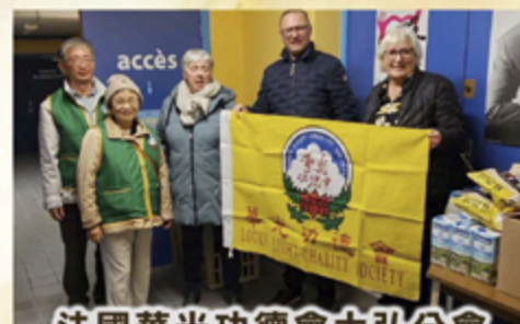
法國華光功德會大弘分會