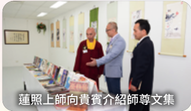
蓮照上師向貴賓介紹師尊文集