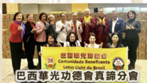
巴西華光功德會真諦分會

今年的「2024全球同步捐贈白米」活動，將於5月1日展開，為期兩個月。透過一份份充滿關懷的愛心物資，我們將溫暖送到每個人的心中。這份慈悲眾生的心，將在世界各地蔓延，讓溫情充滿人間，關愛永不止息。