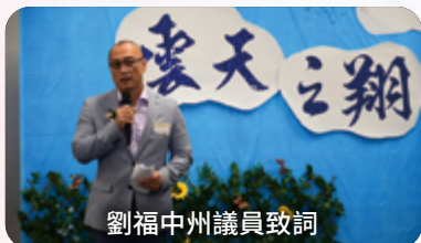
劉福中州議員致詞

這是一場凝聚同門大眾心力，精力，勞力來宣揚聖尊一生弘法功德以及其佛法造詣的展出，禪觀意境特濃，令參觀者內心感動，留下難忘印象。現場很多人都拍照留念，喜氣盈溢。