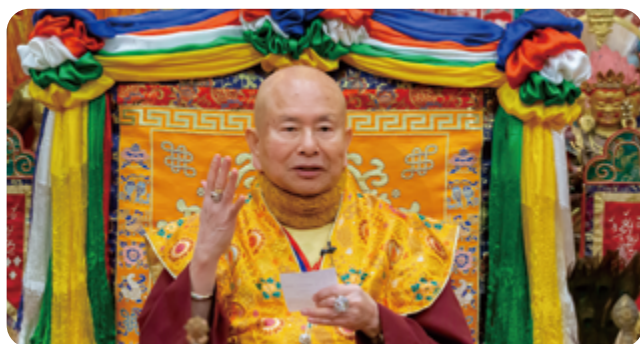
密教修氣除觀修三脈 應視體內為空 從事殺生職業 應修超度法唸往生咒

本期的「你問我答」單元，難得的出現了關於如何修實瓶氣的問題。台灣弟子提問，修「實瓶氣」時是否也如修「九節佛風」時，須觀想「中脈、左脈、右脈」三脈？又問若未來中脈已通，是否不需再觀想三脈，並以意念導引肺部的氣到身體各部位？