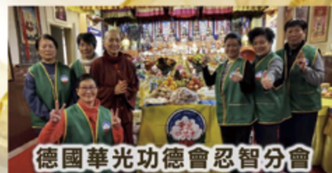
德國華光功德會忍智分會