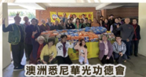
澳洲悉尼華光功德會