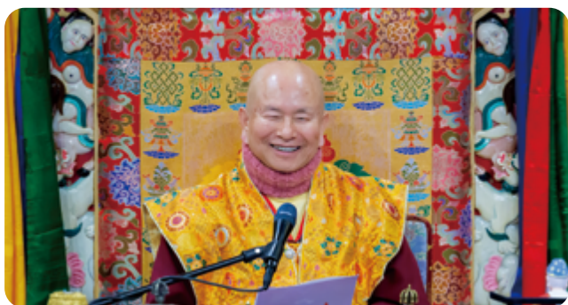
維摩詰問文殊菩薩 何等為如來種 文殊答曰 一切邪見煩惱皆是佛種

蓮生活佛開示：修懺悔法要「立斷」才是真懺悔。 當我們懺悔了之後，就不要再犯，不二過，這才叫懺悔。 如果我們懺悔了之後，還是不斷重複相同的過失，之後又繼續不斷重複相同的懺悔， 這不是「懺悔」，這是「後悔」。真正的懺悔，是「立斷」；是「不二過」。