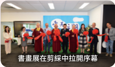
書畫展在剪綵中拉開序幕