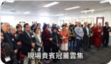
現場貴賓冠蓋雲集