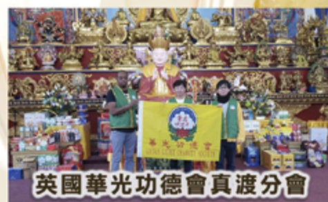
英國華光功德會真渡分會