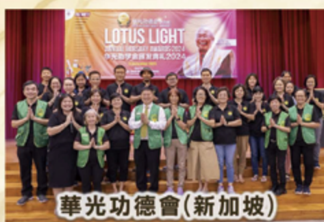
華光功德會(新加坡)