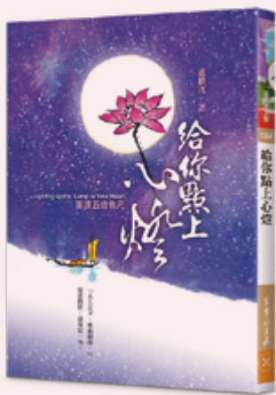
文 / 蓮生活佛盧勝彥文集 第 184 冊—給你點上心燈