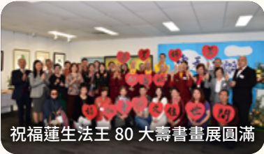
祝福蓮生法王 80 大壽書畫展圓滿