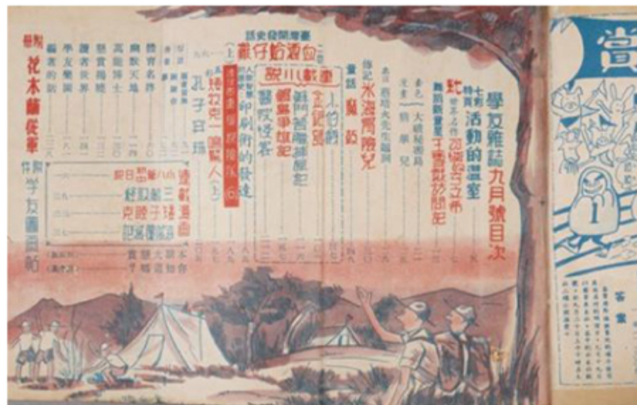
▲從目錄中可以看出連載內容。