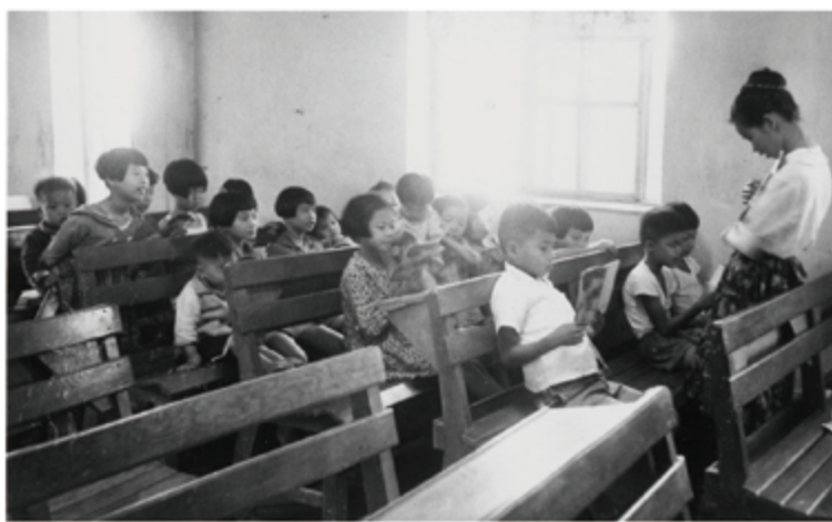
▲兒童聖經故事時間