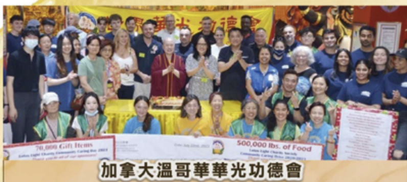
加拿大溫哥華華光功德會