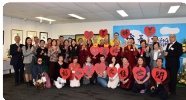
雲天之翔 蓮生活佛書畫展 4/20 在澳洲墨爾本隆重揭幕

為慶祝聖尊 80 壽辰暨創作 300 本文集里程碑，澳洲墨爾本「善明同修會」，在「墨爾本」、「伯斯」、「聖誕島」及「紐西蘭」道場協助下，於 4 月 20 日，在墨爾本 Le Grang Gallery 藝術展覽館，舉辦了一場連續七天的蓮生活佛書畫展。