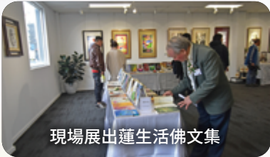
現場展出蓮生活佛文集