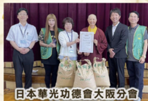
日本華光功德會大阪分會