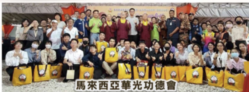
馬來西亞華光功德會