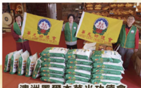
澳洲墨爾本華光功德會