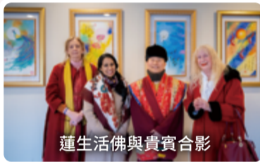
蓮生活佛與貴賓合影

慈悲喜捨」等具有啟發性和幽默的心靈分享。聖尊還談到了擁有信仰的重要性，無論是基督教、伊斯蘭教、佛教或其他宗教，其實先上天堂也是很好的，只要醒悟了，畢竟最終都是擁有光明，回歸本然。這是一場難得殊勝跨越國界、超越宗教的一段身心靈提升文化藝術的互訪。