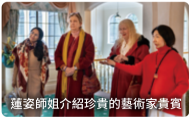
蓮姿師姐介紹珍貴的藝術家貴賓