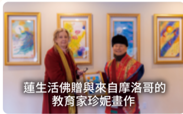
蓮生活佛贈與來自摩洛哥的教育家珍妮畫作